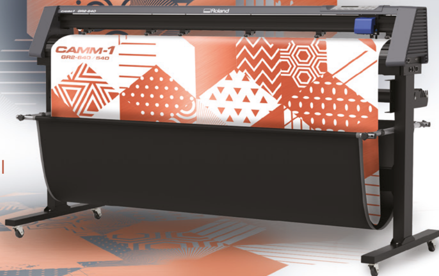
Panier de réception disponible séparément.

Élargissez votre offre avec un traceur de découpe professionnel